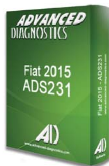
FIAT® 2015 ADS231 - D746536AD