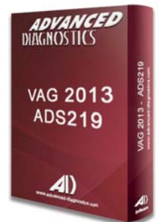
VAG® 2013 ADS219 - D745345AD