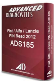
FIAT® 2012 PIN CODE READ ADS185 - D745337AD

Smart Aerial ist mit den folgenden Software-Modulen für die Vorcodierung kompatibel. Die Vorcodierung kann mit den Programmiergeräten AD100 Pro / MVP Pro, Smart Dongle und Smart Aerial, oder alternativ mit dem Programmiergerät AD100 Pro / MVP Pro, Smart Dongle, Power Cable (ADC243) und RW4 Plus / Fast Copy Plus erfolgen.