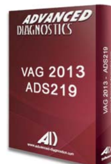
VAG® 2013 ADS219 - D745345AD