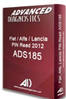
FIAT® 2012 PIN CODE READ ADS185 - D745337AD

Smart Aerial è compatibile con i seguenti moduli software con i quali è possibile effettuare la pre-codifica. La pre-codifica può essere effettuata utilizzando il dispositivo di programmazione AD100 Pro / MVP Pro, Smart Dongle e Smart Aerial, o in alternativa con il dispositivo di programmazione AD100 Pro / MVP Pro, Smart Dongle, il cavo Power Cable (ADC243) e RW4 Plus / Fast Copy Plus.