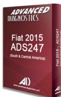
FIAT® 2015 SAM ADS247 - D746561AD