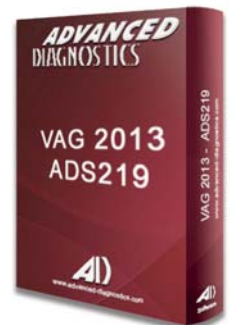
VAG® 2013 ADS219 - D745345AD