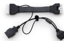
Kabel ADC2017 (Code D755649AD)