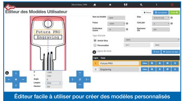
Éditeur facile à utiliser pour créer des modèles personnalisés