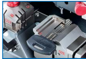
Zone de gravure 3