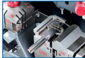
Zone de gravure 2