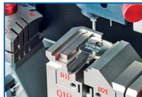
Zone de gravure 4