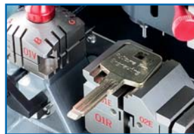
Zone de gravure 1