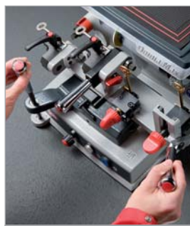
Poignées et leviers chromés

Nouvelle fraise de pointe par son revêtement matériel, sa forme, sa stabilité lors du taillage, sa durée dans le temps, chariot pour la taille des èves, calibre rétractable, éclairage led, étai à mouvement libre et plus encore.