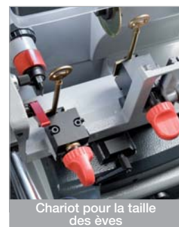
Chariot pour la taille des èves

Silca est toujours au plus près de ses partenaires. Le QR Code de bord permet une connexion immédiate via Smartphone à des instructions vidéo très utiles qui simplifieront et accéléreront toutes les opérations de maintenance et d'installation d'options sur la machine.