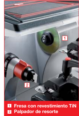
1 Fresa con revestimiento TiN 2 Palpador de resorte

El soporte portaobjetos integrado en la máquina es sumamente amplio, sirve de apoyo para los accesorios y llaves (incluso las más largas) de manera ordenada y cómoda. Con el soporte porta-útiles destinado a las contrapuntas (opcionales) de llaves hembra se encuentra rápida e inmediatamente el accesorio adecuado.