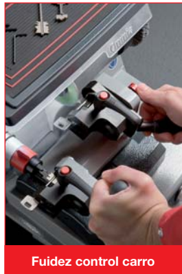
Fuidez control carro

Nueva fresa a la vanguardia tanto por el material de revestimiento como por el diseño y estabilidad en la fase de corte, además de durabilidad, iluminación de led, mordaza de movimiento libre y mucho más.