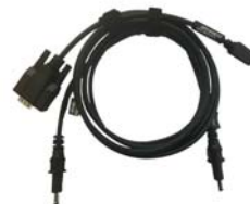
POWER CABLE ADC243 - D746406AD