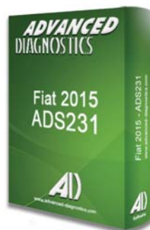
FIAT® 2015 ADS231 - D746536AD