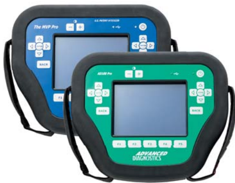
MVP PRO / AD100 PRO