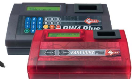
RW4 PLUS / FAST COPY PLUS