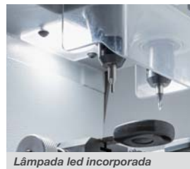
Lâmpada led incorporada

específica de acessórios opcionais para ampliar ainda mais as capacidades de duplicação da máquina.