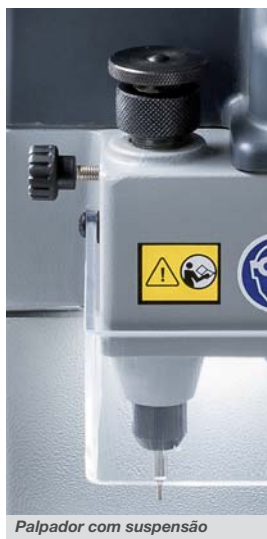
Palpador com suspensão

específica de acessórios opcionais para ampliar ainda mais as capacidades de duplicação da máquina.