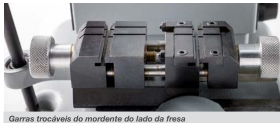
Garras trocáveis do mordente do lado da fresa

O palpador com suspensão, activado por meio de uma especial bucha de regulação, facilita o corte das chaves, assegura um alinhamento perfeito da profundidade de corte e permite corrigir eventuais defeitos em chaves gastas.