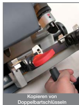
Kopieren von Doppelbartschlüsseln

Der Hauptschalter ist mit einer Sicherheitsvorrichtung ausgestattet, die bei Spannungsausfall die Maschine automatisch ausschaltet. Sobald der