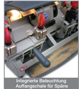
Integrierte Beleuchtung Auffangschale für Späne

Spezialbefestigungssystem für Schlüssel vom Typ Abus® und Abloy®.