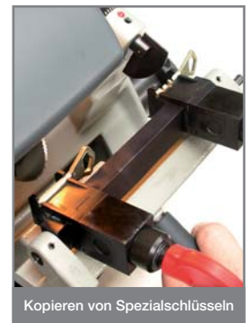
Kopieren von Spezialschlüsseln

Abus® und Abloy® sind eingetragene Marken.