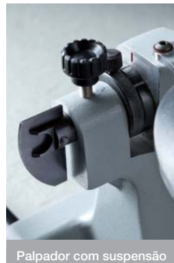
Palpador com suspensão