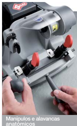
Manípulos e alavancas anatómicos

Os mordentes giratórios de 3 faces permitem posicionar facilmente uma ampla tipologia de chaves sem o auxílio de acessórios opcionais: de palhetão, duplo palhetão, bomba, com encosto central, para caixas de correio e chaves especiais de tipo Abloy®, Abus®, Luma® e Ava Chubb®.