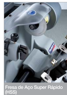
Fresa de Aço Super Rápido (HSS)

Realizada exclusivamente com materiais de qualidade, é um instrumento que vai durar muito, garantido pela marca CE.