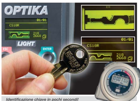
Identificazione chiave in pochi secondi!