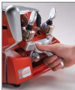
Pulsante per il rilascio del carrello in posizione ottimizzata

Un'ampia area porta accessori dotata di tappetino anti-scivolo, situata sopra il corpo macchina, garantisce il rapido accesso agli attrezzi usati più frequentemente, quali barrette, fermi e pennelli. Sotto il