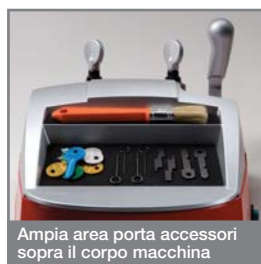
Ampia area porta accessori sopra il corpo macchina

La spazzola per eliminare le sbavature della chiave dopo la cifratura è realizzata in tynex e viene attivata attraverso il pulsante di avviamento della fresa.