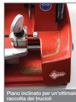
Piano inclinato per un'ottimale raccolta dei trucioli