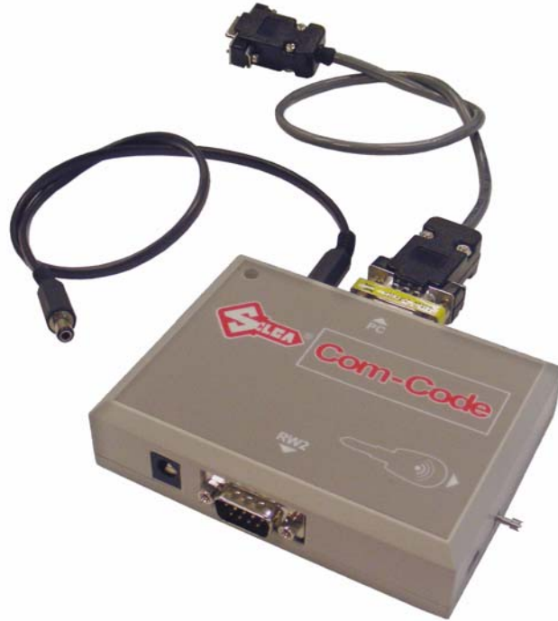
D727028ZB HOLDEN COMMODORE MODUL